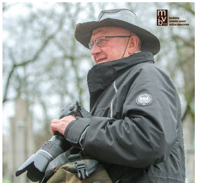
Mažeikių Henriko Nagio viešosioje bibliotekoje